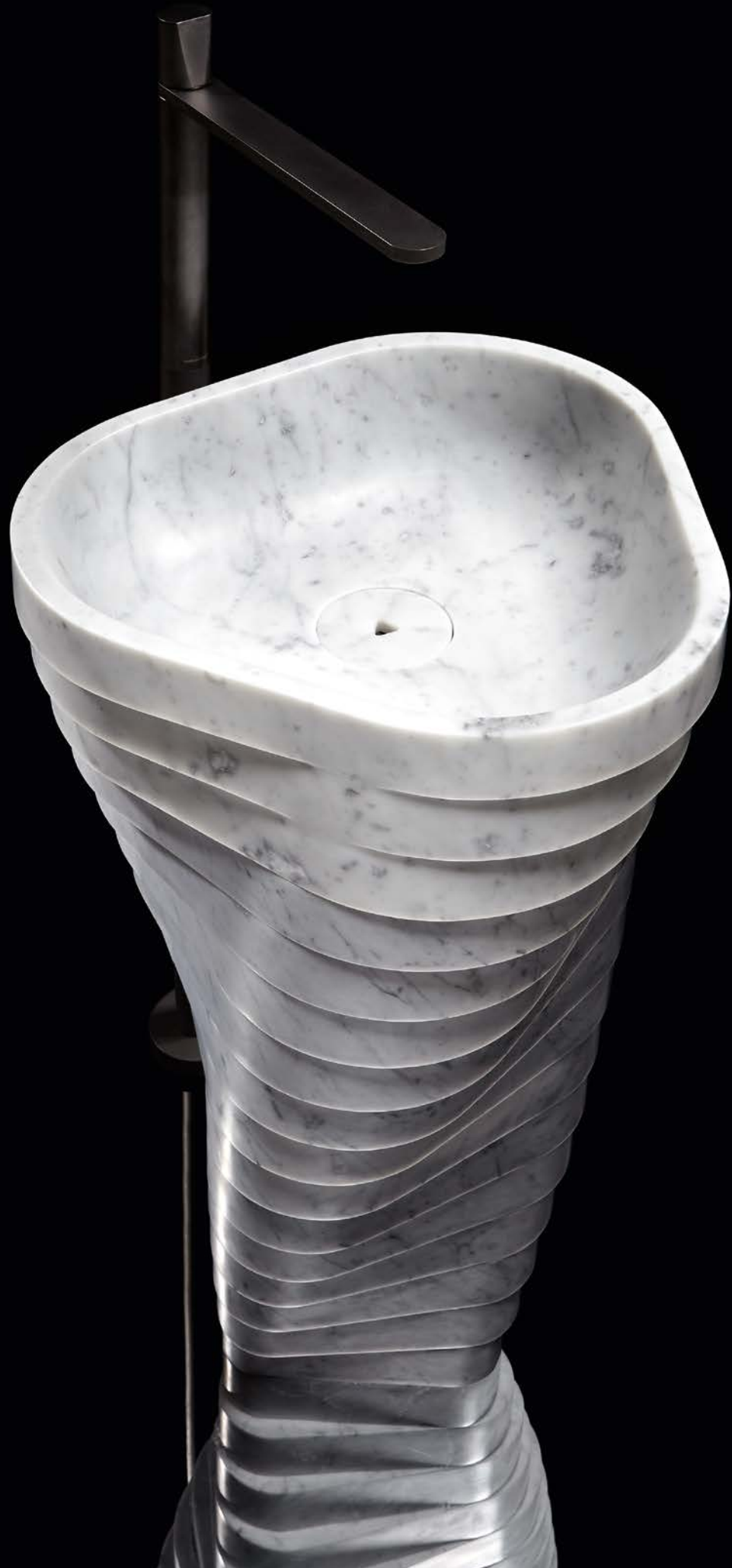
LAVABI FREESTANDING FREESTANDING SINKS