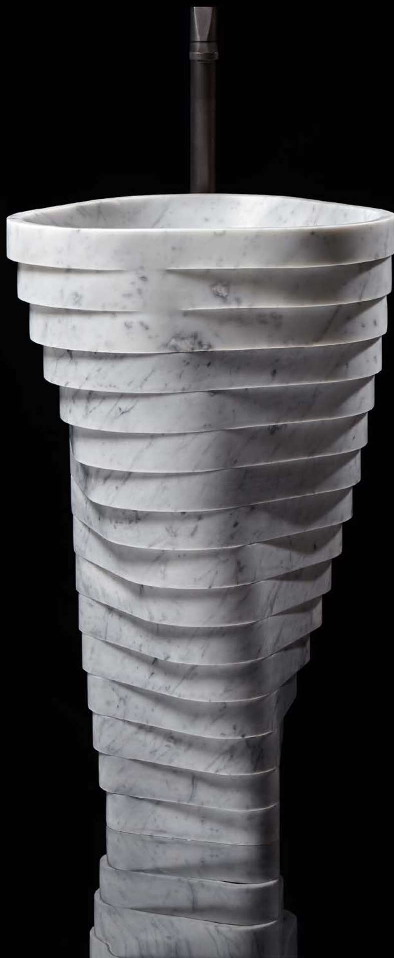
LAVABI FREESTANDING FREESTANDING SINKS